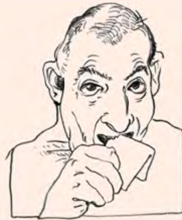
Zeichnung Johannes Grützke aus Heinrich v. Kleist: Michael Kohlhaas

Hochschule für Bildende Künste in Hamburg und als Professor für Malerei an der Akademie der Bildenden Künste in Nürnberg; vor allem aber mit seiner monumentalen Ausmalung der Rotunde der Frankfurter Paulskirche, ein Auftrag, den er im Wettbewerb mit der Crème de la crème der bundesdeutschen wie der DDR-Kunstszene 1987 gewonnen hatte.