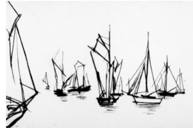
Ursula Strozynski - Regatta III Kaltnadelradierung, Bildformat 28 x 42 cm, Bütteln 40 x 50 cm, Auflage: 35 Exemplare, signiert und nummeriert € 220,- (Nichtmitglieder € 260,-) | NR 052401

liegt auf ihren ausdrucksstarken Kaltnadelradierungen. Werke von ihr befinden sich unter anderem in der Nationalgalerie Berlin, der Ludwig Galerie Schloss Oberhausen und dem Jüdischen Museum New York. Sie lebt und arbeitet in Berlin-Pankow.