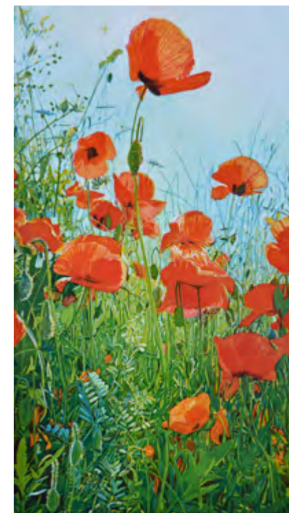
Günther Hermann - Klatschmohn IV Orig.-Farbradierung, Bildformat 60 x 33 cm, Bütteln 76 x 49 cm, Auflage: 75 Exemplare, signiert und nummeriert € 235,- (Nichtmitglieder € 280,-) | NR 052444