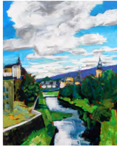
Peter Zaumseil - Wolken über der Stadt Acryl auf Leinwand, 100 x 80 cm, signiert € 1900,- (Nichtmitglieder € 2200,-) | NR 052436

Peter Zaumseil, 1955 in Greiz im Vogtland geboren, war das Künstlerleben nicht in die Wiege gelegt: Er absolvierte zunächst eine Metalllehre, forcierte aber zielstrebig auf eigene Faust eine zeichnerische und malerische Ausbildung: 1979 bis 1986 an der Spezialschule für Malerei und Grafik in Rudolstadt, 1984 bis 1989 durch Lehrgänge bei Günther-Albert Schulz und Wolfram Ebersbach in Leipzig, 1987 bis 1989 in der Förderklasse Malerei/Grafik in Gera. 2002 wurde er mit dem Christoph-Graupner-Kunstpreis ausgezeichnet. Peter Zaumseil lebt und arbeitet in Elsterberg (Vogtland).