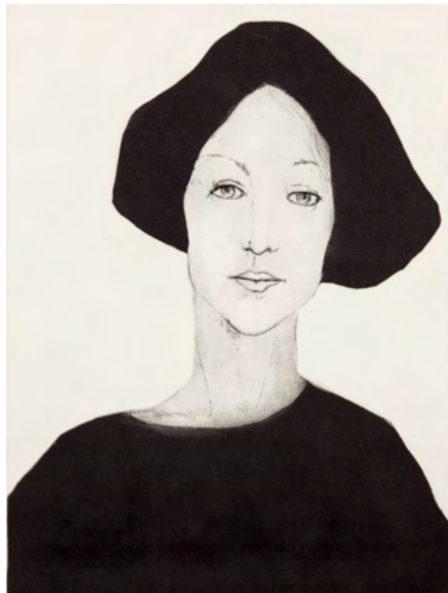
Uwe Golk - Stille Orig.-Radierung, 45 x 33 cm, Bütten 65 x 51 cm, Auflage: 80 Exemplare, signiert und nummeriert € 290,- (Nichtmitglieder € 320,-) | NR 05238X