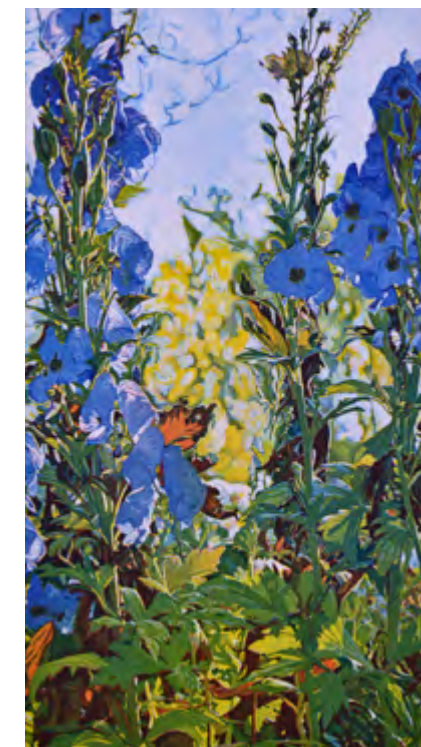
Günther Hermann - Rittersporn Orig.-Farbradierung, Bildformat 60 x 33 cm, Bütteln 76 x 49 cm, Auflage: 75 Exemplare, signiert und nummeriert € 235,- (Nichtmitglieder € 280,-) | NR 052452