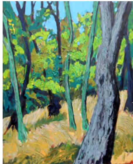
Peter Zaumseil - Im Stadtwald Acryl auf Leinwand, 100 x 80 cm, signiert € 1900,- (Nichtmitglieder € 2200,-) | NR 052428