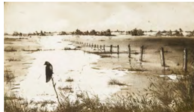
Uwe Golk - Rabenlandschaft 1 Orig.-Aquatinta-Radierung, 29 x 49 cm, Bütten 49 x 65 cm, Auflage: 60 Exemplare, signiert und nummeriert € 290,- (Nichtmitglieder € 320,-) | NR 052371

Uwe Golk, geboren 1955 in Berlin, zeigte schon als Jugendlicher eine außergewöhnliche Begabung im Zeichnen, musste sich aber eine künstlerische Ausbildung durch Nebentätigkeiten als Transportarbeiter, Kleinarbeiter, Aktmodell usw. erarbeiten. Von Anfang an faszinierten ihn die Möglichkeiten der Radierung am meisten, und so richtete er sich 1983 eine eigene Druckwerkstatt ein. Seit 1985 arbeitet er als freischaffender Maler und Grafiker in Berlin.